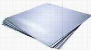
ACM / Alumínio