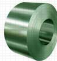
Galvanização a quente