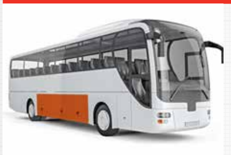
Montagem de partes de veículos.