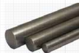
Aço laminado a frio